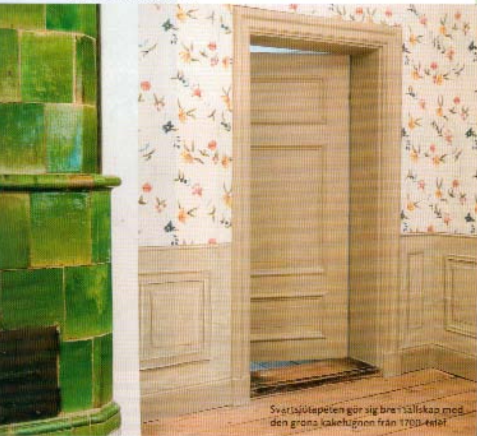
Sverisjütapeten gör sig bra i sällskap med den gröna kakelugnen från 1700-talet

syns mönstret svagt i form av små prickar på våden. Det ger en vägledning om var hon sedan ska måla på fri hand.