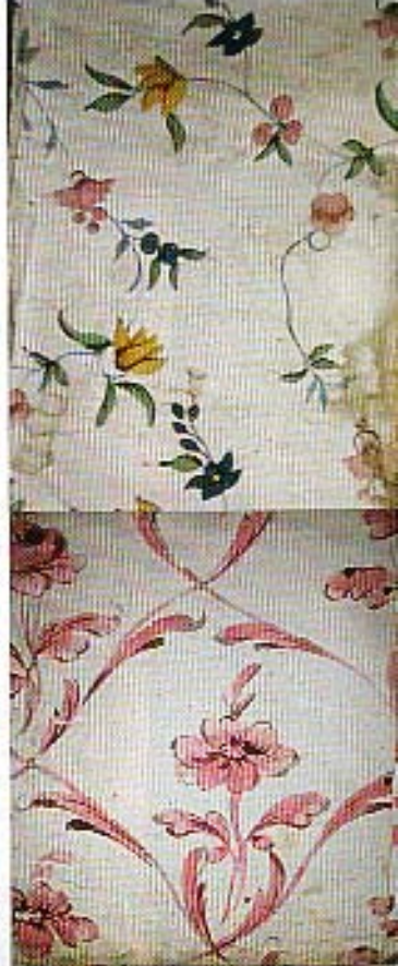
Linnémuseets nya tapeter är inspirerade av 1700-tals-tapeter från Drottningholms slott (övre) och Drottningholmsteatern (undre).