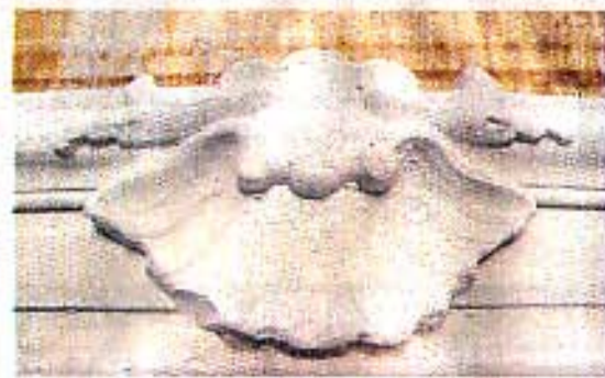
STUKATÖRARBETE. Linnés nya öppna spis kröns av en snäcka. Spisen skall ha samma avnötningar och skavanker som originalet.