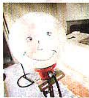
LJUSHUVUD. Arbetet i Linnémuseet startade i augusti förra året och skall vara avslutat i maj.