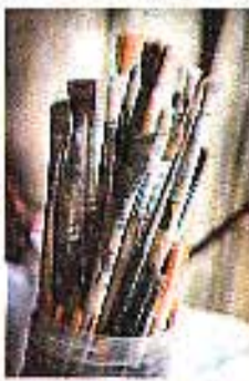
PENSELFÖRING. Föresöket att efterlikna gamla tiders tekniker gäller inte penslarna i syntetfiber.